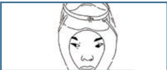
HAENYO, LES FEMMES DE LA MER

Ce film dévoile sept expressions idiomatiques originaires de l'île de Jeju, située au sud de la Corée du Sud. Sa narration à la fois sensible et anthropologique présente la société matriarcale des Haenyo, les femmes de la mer. Les croquis animés révèlent aussi la musicalité de leur langue.