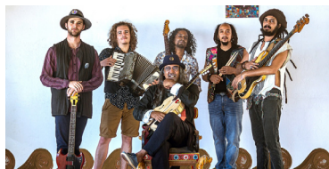
Ziskakan, maloya réunionnais