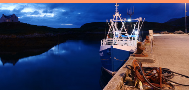
Iorram d'Alastair Cole