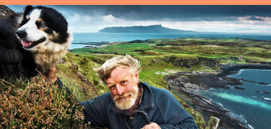
Prince of Muck de Cindy Jansen

L'Écosse possède pas moins de 790 îles, réparties majoritairement à l'ouest et au nord, sur 4 archipels, les Hébrides (intérieures et extérieures), les Orcades et les Shetland, et dont seulement une centaine sont aujourd'hui habitées... Hormis les îles de Lewis, Harris, Skye et les îles principales des archipels des Orcades et de Shetland à la population plus conséquente, plus de la moitié des îles sont faiblement peuplées, avec moins de 100 habitants.